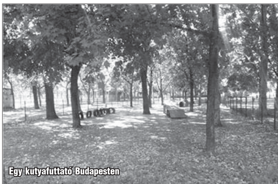
Egy kutyafuttató Budapesten

Egy néhány napja megjelent hírrel kapcsolatban levelezés kezdődött az alapítványunk Facebook oldalán, majd a Nagymaros címűn. A tudósítás arról szólt, hogy a városunkhoz egy milliárd forint fejlesztési pénz érkezik, azonnal beugrott a gondolat, ebből az összegből talán lecsíphető valamennyi a régóta hiányzó beruházásra, a kutyafuttatóra. Valaki megemlítette, hogy céltámogatásról van szó, tehát aligha jut belőle az említett építkezésre, azonnal „újítottunk”, megcsináljuk, meg kell csinálni anélkül is, sok társadalmi munkával, cégek, különösen az építkezéssel foglalkozók bevonásával. Az önkormányzattól a helyszín biztosításához kérnénk támogatást.