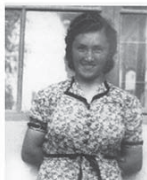
Fotók: Dobróczy Mária négygyűjtése